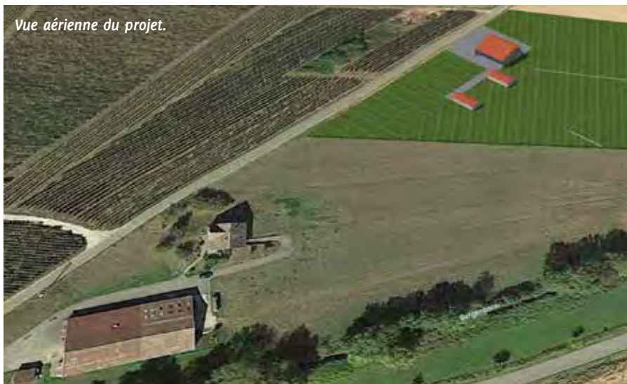
Vue aérienne du projet.

Les poulaillers devraient accueillir les premières occupantes au printemps 2020, puis ce sera au tour des agneaux. Entre la construction des bâtiments, l'arrivée des bêtes, la mise en place d'un centre de tri et de qualibrage des œufs, l'année 2020 s'annonce particulièrement active, d'autant que Marie est l'heureuse maman de la petite Léonie depuis le 10 novembre !