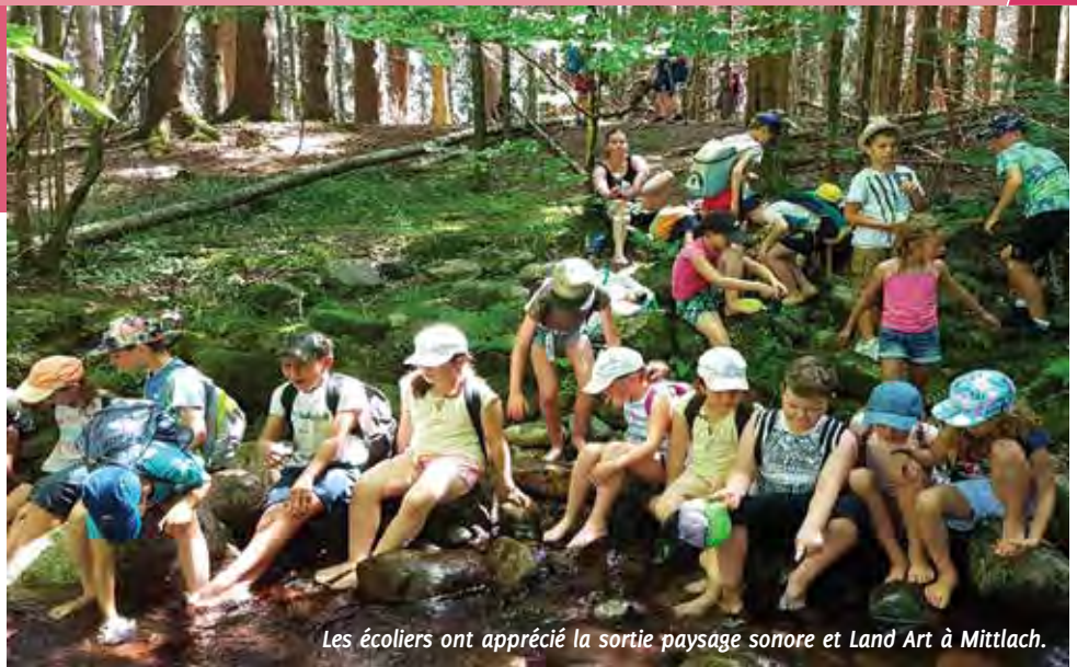
Les écoliers ont apprécié la sortie paysage sonore et Land Art à Mittlach.

Ce jour-là, les enfants ont aussi marché dans la forêt et traversé une rivière glacée en faisant également une chaîne humaine. Une très belle expérience pour tous.