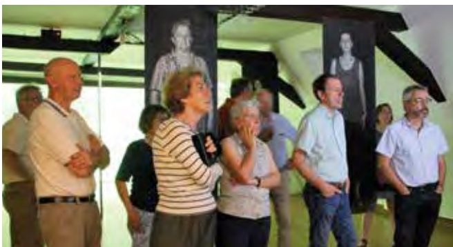
Le public présent a découvert les nouvelles installations de la 3 ème salle de la Maison des Sorcières.

La Maison des Sorcières, située sur le parvis de l'église, est ouverte de mi-juin à mi-octobre. Pour plus de renseignements (jours d'ouverture et horaires), rendez-vous sur son site Internet : https://haxahus.org/ ou sur celui de la ville de Bergheim : https://www.ville-bergheim.fr