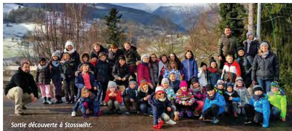
Sortie découverte à Stosswihr.

Deux animateurs chevronnés ont accompagné les enfants durant tout le séjour pour leur faire découvrir les secrets de la nature ! De très beaux souvenirs pour les enfants et leurs maîtresses !