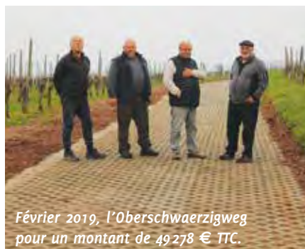
Février 2019, l'Oberschwaerzigweg pour un montant de 49 278 € TTC.

Dans la continuité du programme de réfection de chemins ruraux, TP et TRANSPORT SCHMITT a repris le carrefour du Holzgraben sur une surface de 340 m 2 pour un coût de 19 944,96 € TTC.