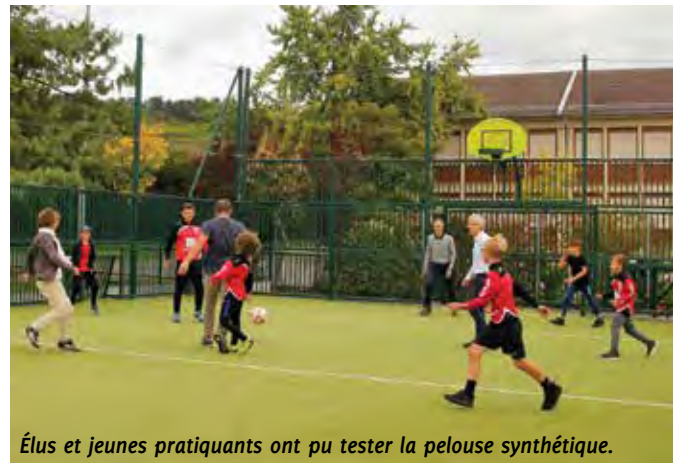
Élus et jeunes pratiquants ont pu tester la pelouse synthétique.