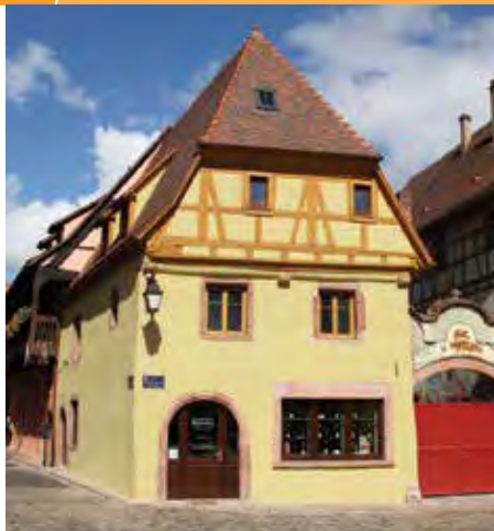
Quelques exemples de rénovations réussies.