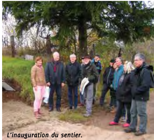
L'inauguration du sentier.

Il faut compter 3 heures 30 pour effectuer cette randonnée de difficulté moyenne avec des pentes plutôt raides en montée comme en descente. Le dénivelé est de 333 m pour une distance de 8,34 km.